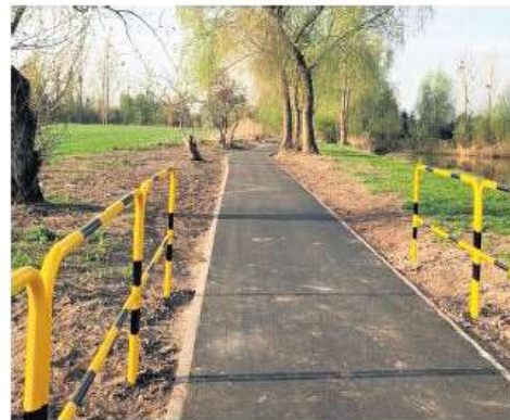
Jeden z gotowych odcinków Dolnośląskiej Autostrady Rowerowej w Prusicach

Przedsięwzięcie ma charakter projektu partnerskiego. Inwestycja, oprócz wnioskodawcy – gminy Prusice, obejmuje gminy Żmigród i Wołów.