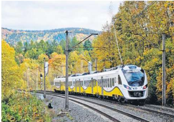
Tabor Kolei Dolnośląskich to już 57 nowoczesnych pociągów

Nowy tabor elektryczny ma obsługiwać połączenie: Jelcz - Laskowice - Wrocław Główny - Jelcz - Laskowice, a spalinowy: Trzebnica - Wrocław Główny - Koberzyce - Sobótka Zachodnia. Dla wielu mieszkańców Dolnego Śląska szcze-