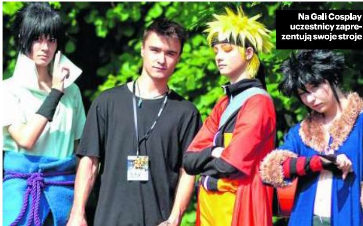
Na Gali Cosplay uczestnicy zaprezentują swoje stroje