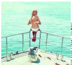
FOT. KAMR z FILMU „HOLIDAY”