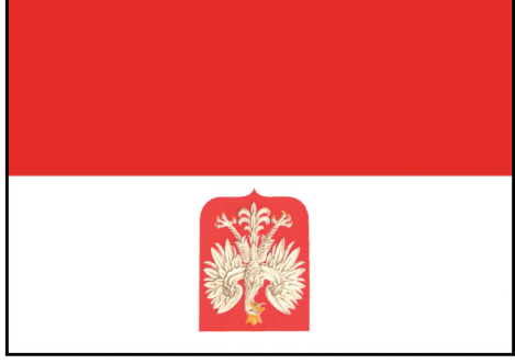
Flaga państwowa z godłem

Jeśli eksponuje się na masztach więcej flag, flagę państwową RP podnosi się (wciąga na maszt) jako pierwszą i opuszcza jako ostatnią.