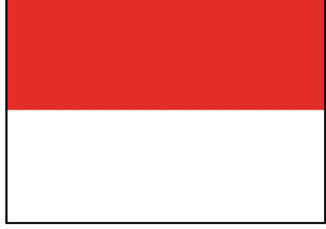
Flaga państwowa RP

Hierarchii tej należy przestrzegać na zewnątrz i wewnątrz budynków lub obiektów sportowych. Z wymienionymi flagami nie wolno eksponować flag reklamowych.